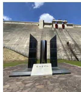
定山溪ダム下流園地