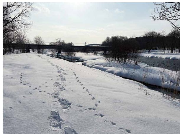
河川敷の新雪をスノーシューで散策