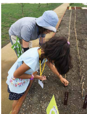
北彩都ガーデンで種まき体験