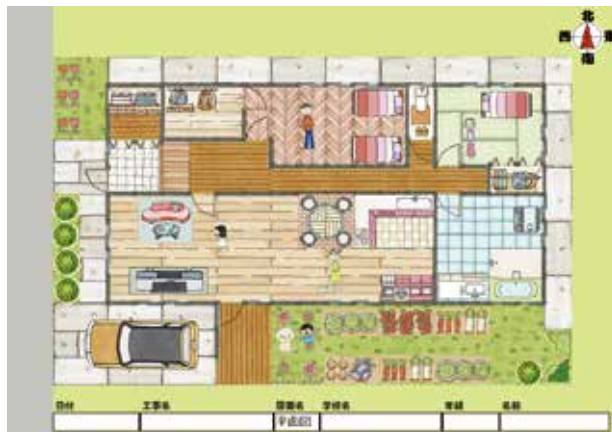
新バージョンのアプリによる間取り作成例

これらのアップデートにより、更に充実した住教育へとレベルを上げることが可能になりました。アップデートを終えて間もなく、令和6年12月20日に北見市立高栄小学校6年1組2組計43名の児童を対象とした「パズルで住まいを考えよう」出前授業を実施しました。この出前授業の開催にあたって北見支部女性委員会の皆様には大変なご助力をいただきました。改めて御礼申し上げます。