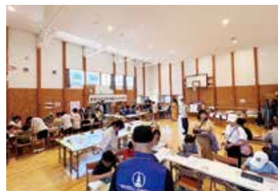
建築士のお仕事体験イベント