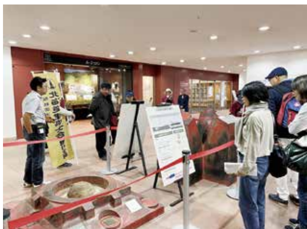
必見！駅中展示の四叉柱

旭川支部 女性委員会では、毎年、社会貢献事業を実施しています。対象は子供から大人まで幅広く、やりたいこと・やってみたいことの企画はたくさんあります。今回、令和6年北海道建築士会特別活動費助成事業に応募する機会を頂き、以前から温めていた「まち歩き」をチョイスしました。事業計画を具体的に立てるのはとても大変ですが、女性委員から魅力的な意見がたくさんあがり実行可能な計画へと発展させることができました。申請が通った時は、嬉しさと同時に事業の大きな課題である『集客』という言葉がプレッシャーとして重くのしかかってきました。大切な予算なので、閑古鳥が鳴くことがないようにという思いが強かったです。