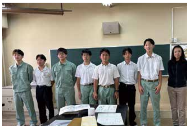
苦小牧工業高校 先生と選手の皆さん