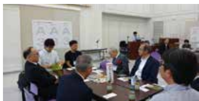
ひだカフェ「A3テーブル」

テーブルごとに「問い」が設定されており、1) どうする？全道大会、2) どうする？支部活動、3) どうする？会員増、4) どうする？労働力不足の4点で、座席も既に指定され少人数ごとに分かれて配席されていました。テーブルマスターのリードでまずは、自己紹介からスタートしてリラックスした