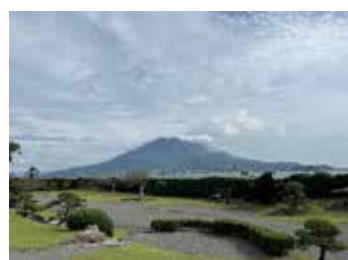
鹿児島市内仙巖園より望む桜島

も無事終わり、宝山ホールを後にし、鹿児島駅に隣接した「かんまちあ」会場に市電で移動して、大交流会が始まりました。「うなぎ」や「黒豚」「芋焼酎」などの鹿児島県が抱える