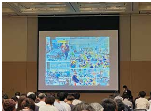
北海道ブロックの発表

それをインターネットでそれぞれの会場に中継するというスケールの大きいもので、資料や説明も簡潔でとても良かったです。すべてのブロックが発表を終え、審査委員と参加者がスマートフォンから審査フォームにログインして10分間で採点します。採点が終わりと、壇上に各ブロック代表者が登場し審査発表の結果を待ちます。まず「奨励賞」として5つのブロックが選ばれました。その中に北海道はありません。これで優秀賞以上が確定したわけです。「これはもしかするともしかするぞ?」とドキドキしてきました。そしてその瞬間は訪れました。優秀賞は「中四国ブロック」そして最優秀賞は「北海道ブロック」！北海道としては初の快挙です。北海道青年委員会のみなさん、本当におめでとうございます。