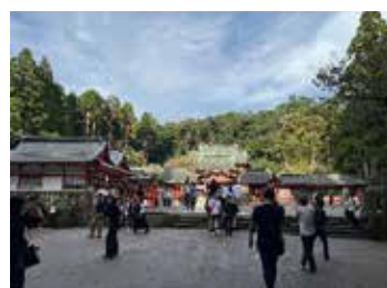
参拝客で賑わう霧島神宮

食のコンテンツを存分にいただく事ができました。これほどの食材を準備していただいたのには大変驚きました。