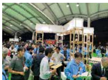
「かんまちあ」で行われた大懇親会

度の大阪大会案内があり、大会後に行われるエクスカッション用に万博チケットを、2000枚用意する予定との事でした。大阪大会も楽しみです。大会式典