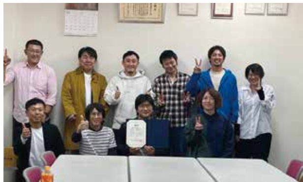
11月の委員会での集合写真

残りの任期、委員のメンバーを含め青年全体が「楽しい」と感じてもらい何か一つでも仕事に活かせることを持ち帰っていただける「会」としたいと考えております。