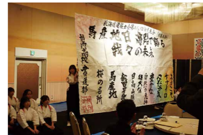
余興 (「静内高校書道部」による作品)