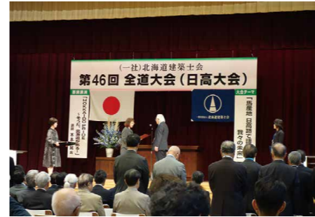
永年表彰受賞の様子