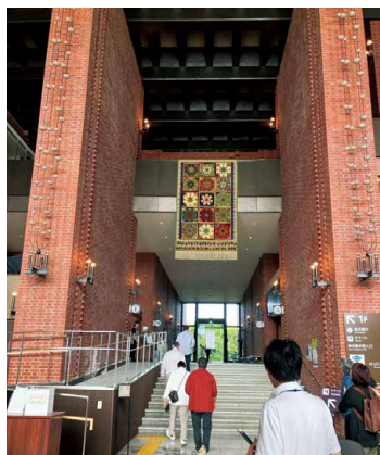
タペストリーが印象的な入口

秋晴れが気持ちのよい9月初旬、今年的女性建築士の集いのテーマである『江別レンガ』をめぐる…は、北海道博物館よりスタートした。恥を忍んで書き綴ると開拓記念館の方へは何度も足を運んだことがあったが、博物館は初めてだった。駐車場から眺めるとそれほど大きな建築とは感じなかったが、正面から進んでいくと矩形のレンガの建築の迫力と列柱の細さ、高さに圧倒され心が弾んだ。中へ進んでいくとエントランスの天井の高さや北海道の自然を描いた巨大なタペストリーが目に入り自分が小さく感じる。アプローチデッキからロビーの延長には額縁に見立てた北側出入口とガラス窓があり、今はなき記念塔をとらえられたようだ。