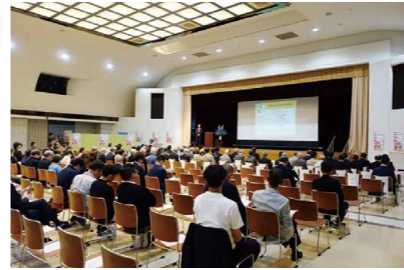
基調講演 (会場の様子)