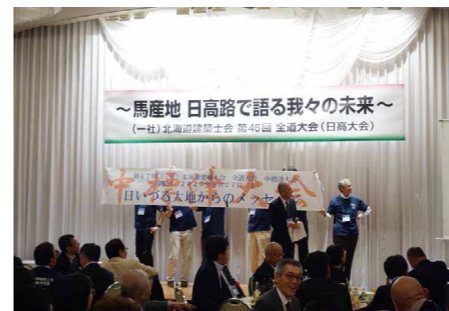
次期開催地PR (中標津支部)