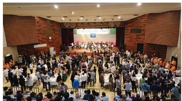
コロナ禍前のビールパーティー

を500円値上げの2500円にし、チケット販売の予定枚数を例年の半分600枚にして実行しました。5年ぶりということで予定どおりチケットが売れるか心配でしたが、予想より枚数は売れてチケットも増刷するほどでした。当日の入場者はチケット売上枚数の7割以上の方が来ていただき大変盛り上がりました。来年はコロナ禍前と同じような規模で開催したいと思います。