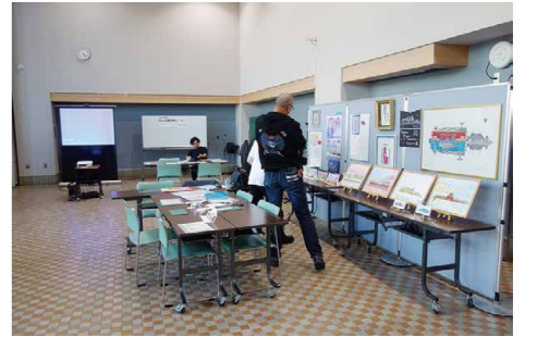
応急危険度判定・机上訓練 折紙建築ブース