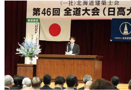
ひだカフェ報告 (森 日高支部理事)