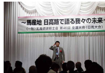
懇親会締めめの挨拶 (高野顧問)