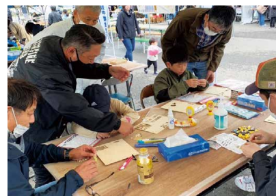
第17回中標津地方技能士会主催「技能祭」参加（木工作）

と、AIが私に代わり建築士会の未来を示してくれました。さて次は建物の設計をしてもらおう。