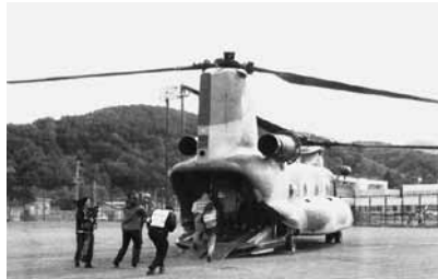
ヘリコプターで避難する参加者 =中島スポレク広場

私は、ワゴン車で避難しましたが、渋滞等はなくスムーズに移動できました。各町村は、小樽、札幌方面へと避難しましたが、現実となったら風向き次第では何処へ避難したら良いのか分かりません。