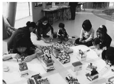
すごい集中力の子供達

最後になりますがブロックを貸して下さった旭川青年委員会の皆様、本当にありがとうございました～！！