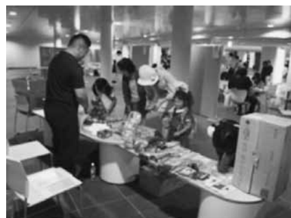
ご褒美の通貨で模擬店で買い物