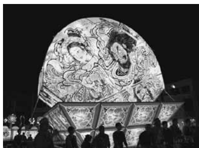
7/26・27開催 しれとこねぶた

「故郷は遠くにありて思うもの」と思っていたのですが、遠くに思うのは距離だけで、心を近くに持っていれば、遠くに居る友とも、昨日会ったように出会える気がします。出会えなくなった人にも、笑顔を思い出して！