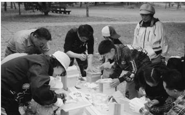
巣箱から小鳥が顔をのぞいているのを想像しながら…

昨年も継続事業として震災復興チャリティビールパーティを開催して益金を義援金として日本赤十字社に寄付しています。現在まで8回目となる高齢者施設慰問活動として音楽コンサートの支援を続けています。