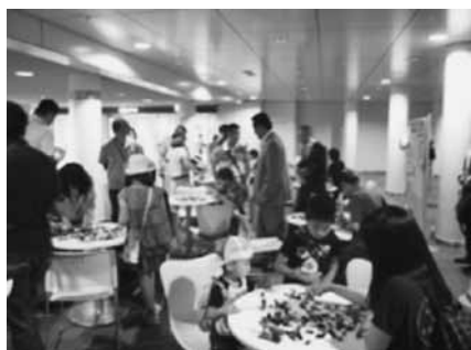
建築士のお仕事体験の子ども達（理想の家を描く、折り紙建築、ブロック玩具でまちづくり）