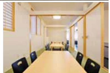
写真：上/カウンター席を望む 下左/店舗内全景 下右/小上がり席