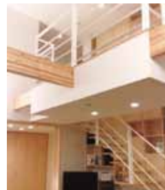
写真：上/外観 下左/外観 下右/リビング