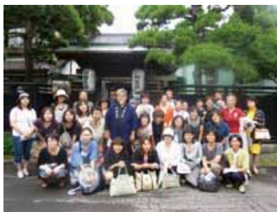
旧相馬邸の前・参加者全員で

耐震に配慮された東本願寺。大正ロマン感じさせる建物が立ち並ぶ界隈が坂の町に美しく溶け込んでいました。教会の礼拝堂からは美しい声に癒され散策を満喫しました。