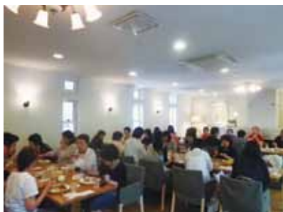
フランス・スイーツレストラン「バジェ・ミニヨン」

参加いただいた皆様、集いの準備に係わっていただいた方々、本当にありがとうございました。