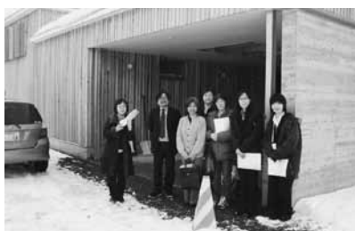
外壁に道産材を使用した住宅