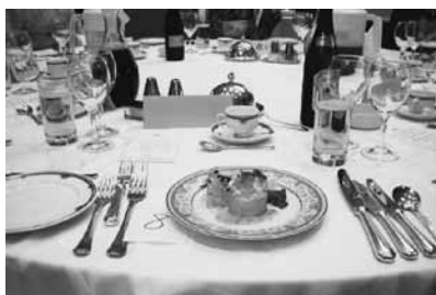
テーブルセッティングの講習