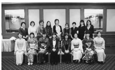
旭川の女性メンバーが集合

総会後の新年会と勉強会を兼ねたディナーでは、ホテルの方に講師をして頂き、テーブルマナーを勉強しながら、おいしくフレンチのコース料理を頂きました。