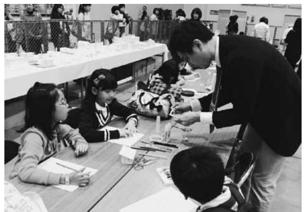
札幌支部青年委員がスタッフ参加した「ミニさっぽろ」の様子

現在企画しているイベントは、子どもたちを対象に、建築のお仕事を体験して、お給料（独自の紙幣）をもらい、そのお給料でブース内に出店するお店（駄菓子、おもちゃ、ジュース）で買い物ができるといった、「キッザニア」や「ミニさっぽろ」のミニチュア版のようなものです。具体的なお仕事は、各支部で行われている地域実践活動である①折り紙建築（釧路支部）②ブロック玩具のまちづくり（旭川支部）③カラスよけプラダンゴミサークルの作成（札幌支部）。その他「自分の理想の家を描く」「マグネットボードで家の間取りづくり」などの案が出ており、企画を進めているところであります。