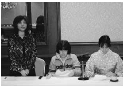
24年度の事業計画を報告中

総会後の新年会と勉強会を兼ねたディナーでは、ホテルの方に講師をして頂き、テーブルマナーを勉強しながら、おいしくフレンチのコース料理を頂きました。