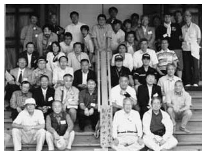
【第32回青函松交流会の様相】