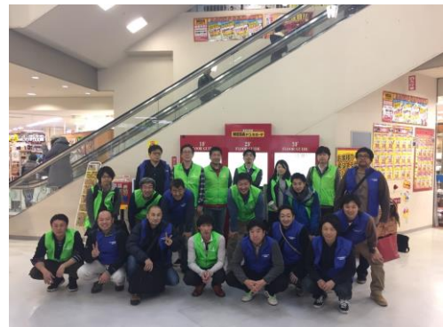
道南ブロック青年委員