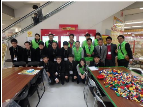
苫小牧工業高等学校生徒の 皆さんと苫小牧支部