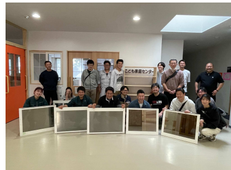
成果品と記念撮影