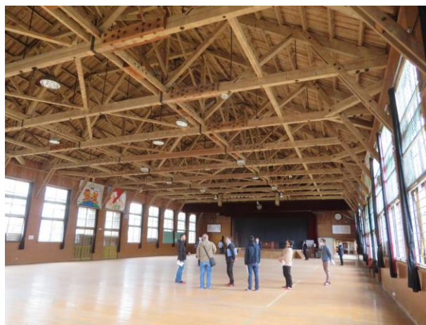
・現在も立派な木造の屋内運動場