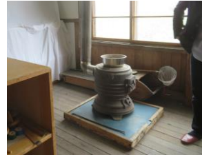
・懐かしい石炭ストーブ