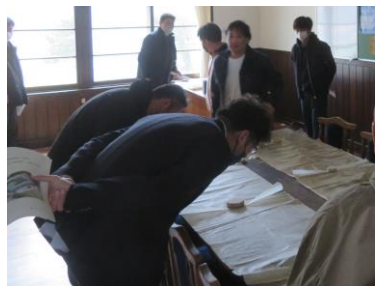
・校長室に展示されていた図面