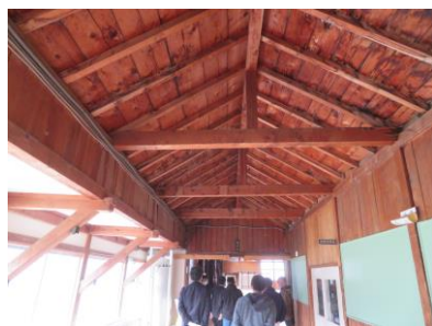
・校舎と体育館をつなぐ渡り廊下