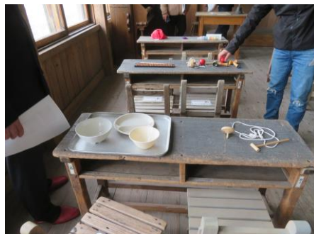
・給食の食器やレトロ玩具など