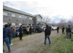
・概略説明の様子