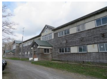
・旧増毛小学校の外観

昭和11年に建てられた学校は道内で最大最古の木造校舎であり、北海道遺産にも指定されていて、最盛期には1,000人以上の児童が通っていたという歴史を感じながら、石炭ストーブやけん玉などの遊び道具を見るとタイムスリップした感覚になり、時間の流れが遅い古き良き昭和を体験できました。（個人談）