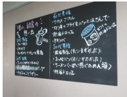
・おいしそうな給食メニュー