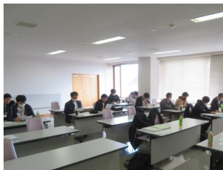
・ブロック協議会状況