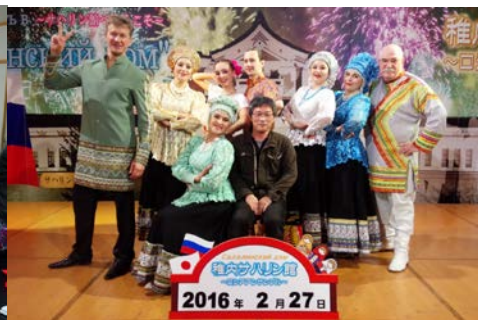
ロシアアンサンブル開演見学