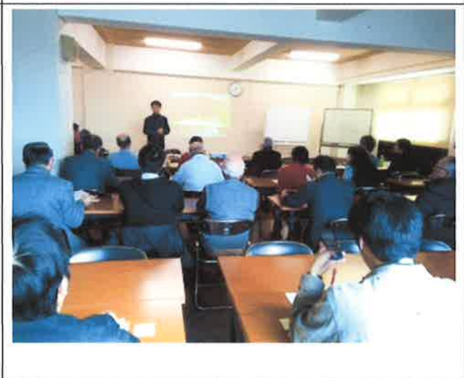
講座「廃校活用の可能性を学んで、考えよう」