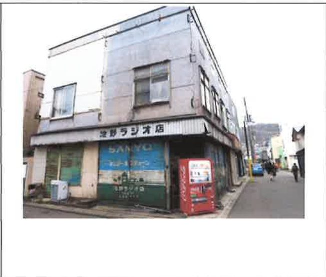
室蘭市輪西町の歴史的建造物調査（まち歩き）