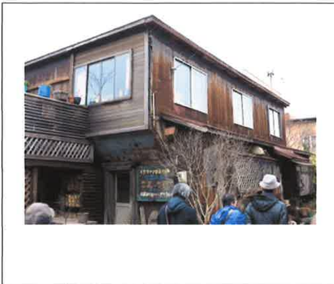
室蘭市輪西町の歴史的建造物調査（まち歩き）