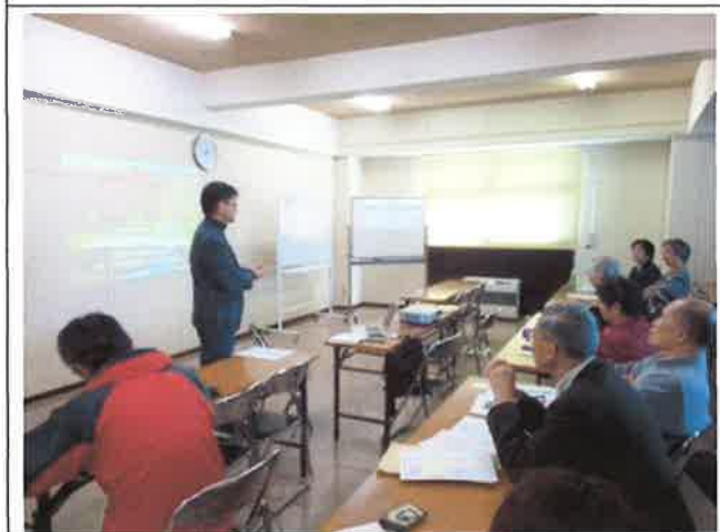
講座「廃校活用の可能性を学んで、考えよう」