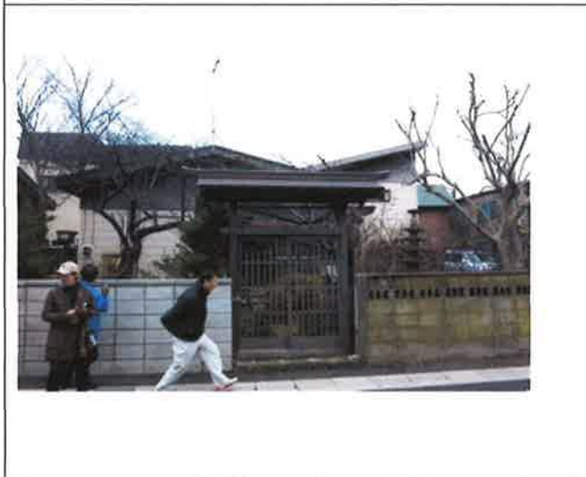
室蘭市輪西町の歴史的建造物調査（まち歩き）