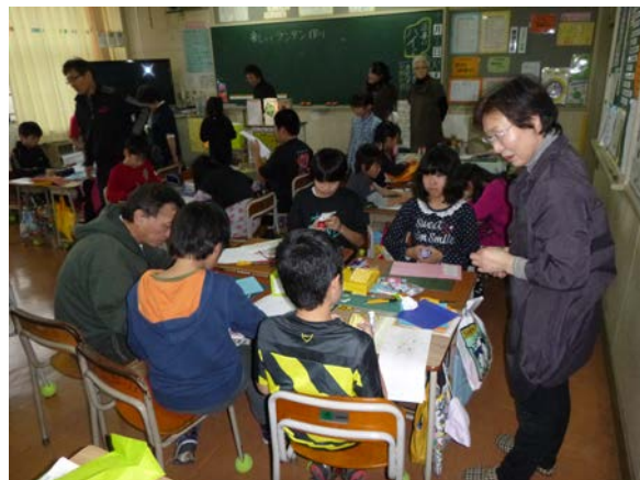
事前ワークショップ（小学校4年生）