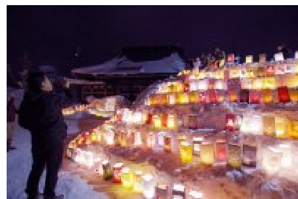
ランタン点灯状況