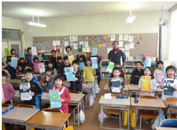
事前ワークショップ（小学校2年生）