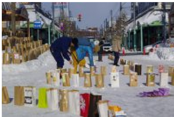
ランタン設置作業