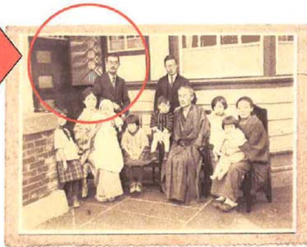
<創建時の坂牛邸の写真 現在は照明器具が失われている>