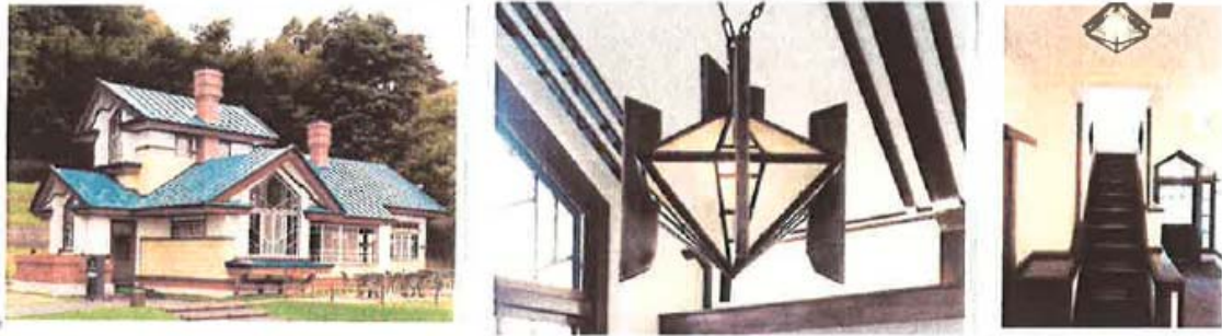
<参考とした、旧小熊邸の照明器具の写真>