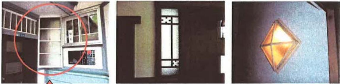
<現在の坂牛邸 照明器具の現状 左2つは創建時から現存中>