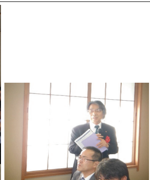
連合会三井所会長の総評