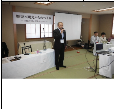
開会挨拶：針ヶ谷委員長