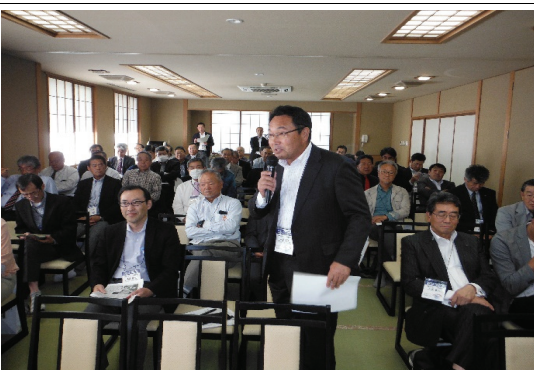
参加者からの意見