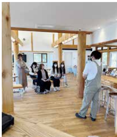
K I T E N で施設の説明を聞く様子

士会のメンバーも、見学しながら施設説明を聞いて、熱心な質問も飛び交い、中高生たちはボードゲーム等でコミュニケーションをしていました。