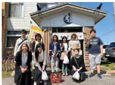
地元のカフェでのランチ

これからも K I T E N が自由な発想で、自然と人と地域が繋がる「基点」となり、新しい交流が始まる「起点」となる場所という、運営の目指すコンセプトのように施設が活かされていく事を願っています。