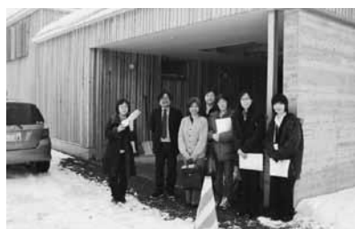
外壁に道産材を使用した住宅