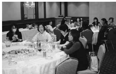
マナーの講習を受けながら食事