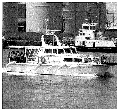
—港湾業務艇「たんちょう」—

Bコースは「釧路ランチ」です。湿原から中心市街地に戻って、釧路ならではのメニューでお昼ご飯を召し上がって頂きます。