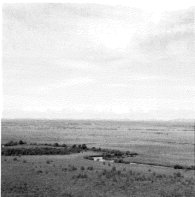
—自然の宝庫…雄大な釧路湿原—