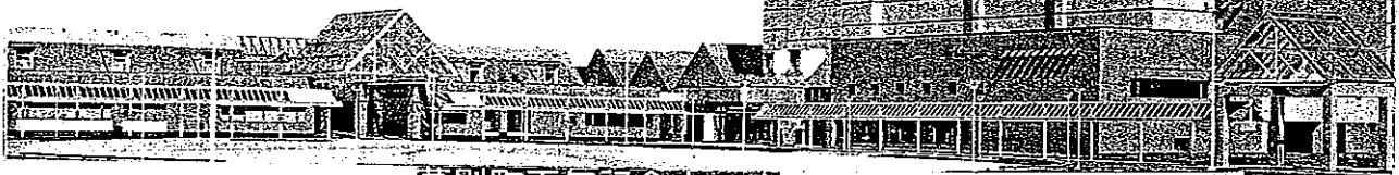
幕別百年記念ホール