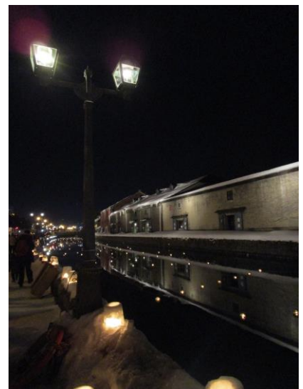
★小樽運河会場 浮き球キャンドル