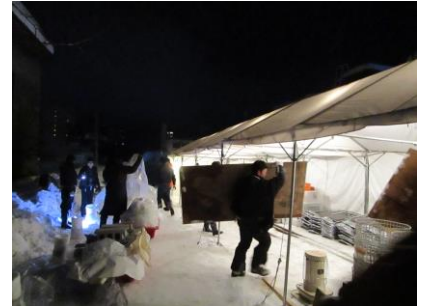
★最終日は全員で解体作業。(お手のもの!)