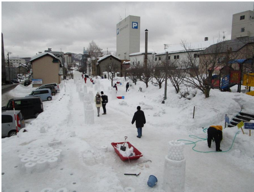
★期間中は毎日、日中にオブジェを制作します