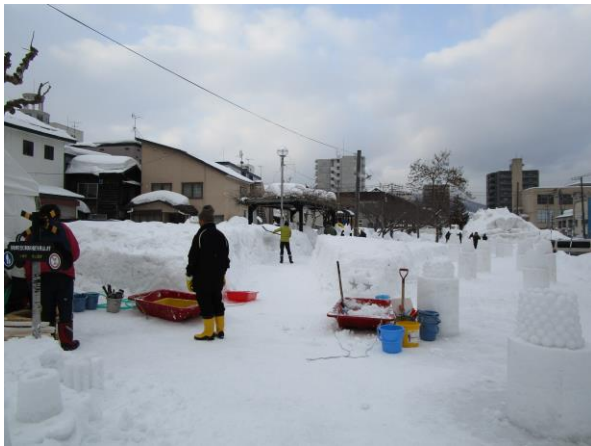
★パールキャンドルは雪玉を重ねて作ります