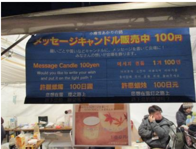
★メッセージキャンドルも販売