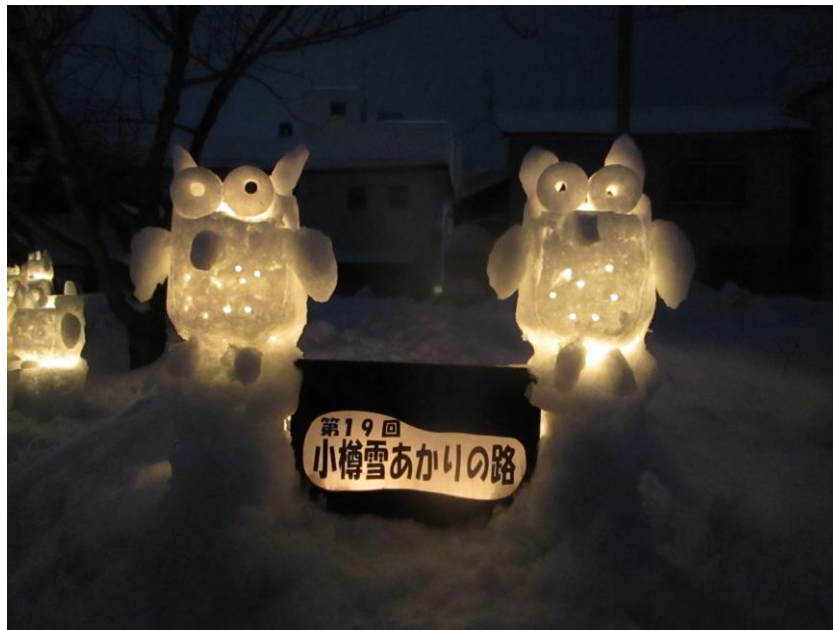
★フクロウの森 フクロウは建築士会会員のオリジナル作品