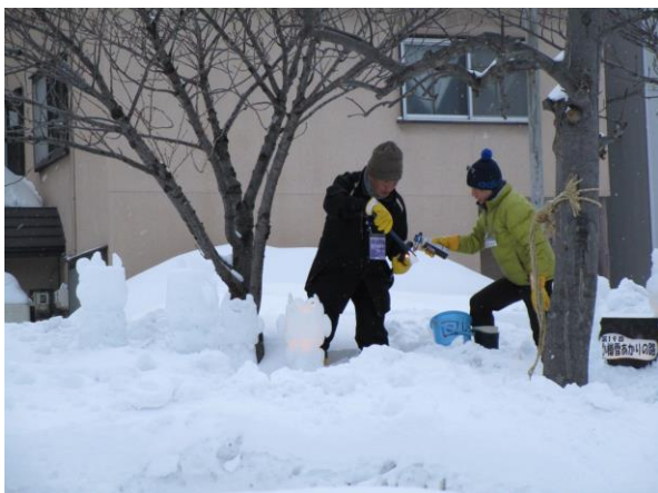
★午後4時半頃 オブジェやキャンドルにひとつひとつ手で火を灯してゆきます