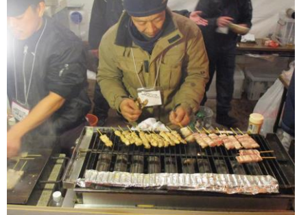
★焼き鳥は外国観光客にも大人気