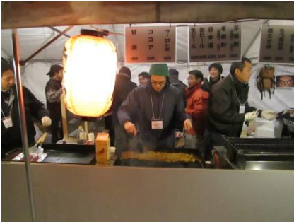
★定番メニューの焼きそば