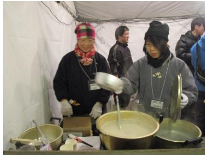
★甘酒は女性委員会担当