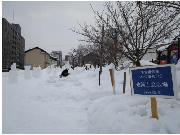
★建築士会担当のエリア(旧手宮線会場)