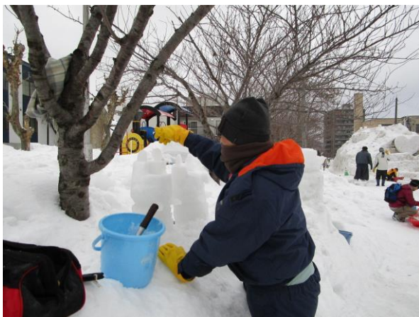
★大人気のフクロウのオブジェ、完成間近