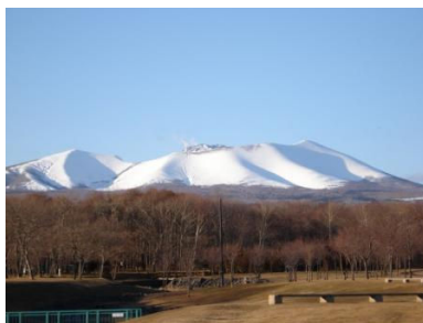
樽前山 (アルテンより)

コンビニでは、建築士のアドバイスのもと光をよく反射する仕上材に替えることで、店内の照明を減らすなど特別なことをするのではなく、ちょっとした工夫で環境に配慮した店づくりが進められています。斬新性・独創性そして柔軟な発想が大きな変革へ繋がるはず。紙の街苫小牧で若手建築士の視点から、見て・聞いて・体験して、リサイクルそしてエコロジーさらに未来を共に考え、今後、自ら発信して頂ければと思います。