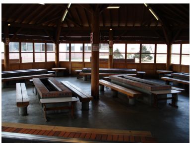
懇親会 (パ・エ・キューバス)