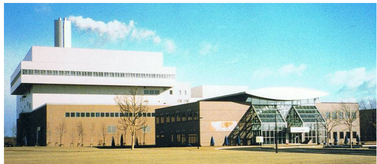
会場:リサイクルプラザ苫小牧