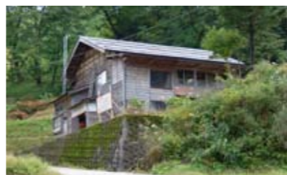
■中越震災復興プランニングエイドにおいて中山間地再生に向けた定住実験を行っている民家

に評価員を送り、商店街の美しさを客観的に把握する調査や、日本屋根外装工事協会と協力し、屋根景観に関する研究やコンテストを実施しています。