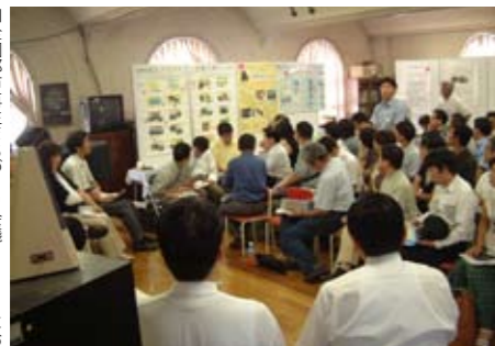
■ 全国都市再生まちづくり会議2006における交流の様子(中央区常盤小学校)