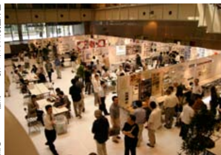
■ 全国都市再生まちづくり会議2005の会場(新宿区工学院大ホール)