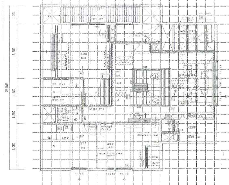
イオンマイホームセンター釧路展示場