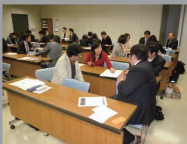
参加者同士で課題に対してディスカッション中