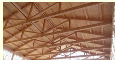
▲流通製材と住宅用プレカットによる12m 2 の山形トラス

つきましては、この機会に意匠設計に携わる建築士や建築関係技術者の多くの方々の受講をお願い致します。