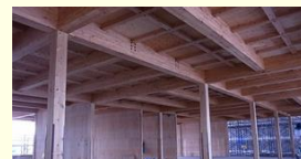
▲中断面集成材と住宅用梁受金物による6mグリッド2階床組+高倍率耐力壁