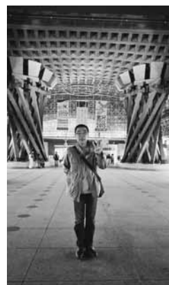
金沢駅前 もてなしドームにて