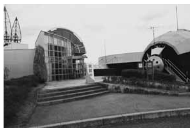
特徴的な「能登島ガラス美術館」

ゆっくりのつもりがかなり駆け足になってしまい、能登半島の奥の深さを実感しました。文章ではイメージできないと思います。百聞は一見にしかず。ぜひ行って見てきてくださることを切望いたします。