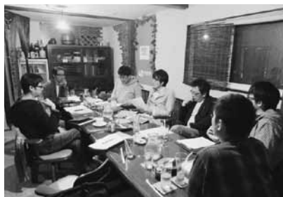
喫茶ボンボンでの会議

「青年建築士の集い」を倶知安町で開催するために立ち上げた道央ブロック実行委員会のメンバー10名がテーブルを囲んでいました。