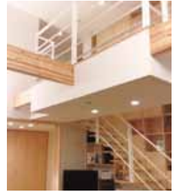
写真：上/外観 下左/外観 下右/リビング