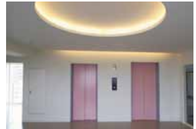
写真：上/外観 下左/エントランス 下右/EVホール