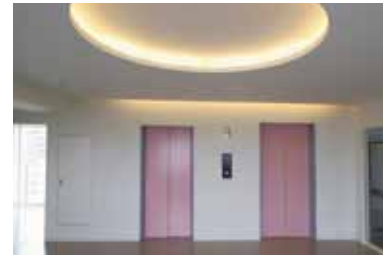
写真：上/外観 下左/エントランス 下右/EVホール