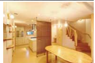
写真：上/外観 下左/夕暮れ時のウッドデッキ 下右/リビング