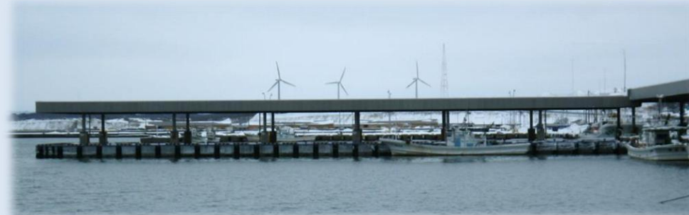
H26 某漁港衛生施設建設工事 現場代理人