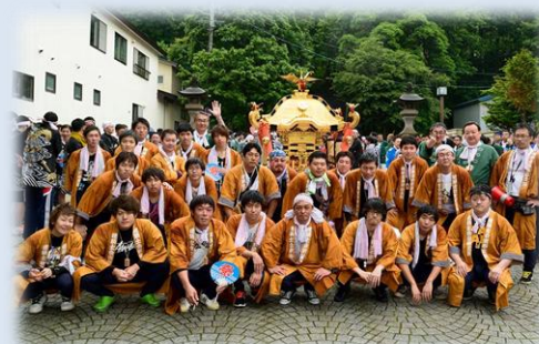
地域貢献活動 神輿担ぎ