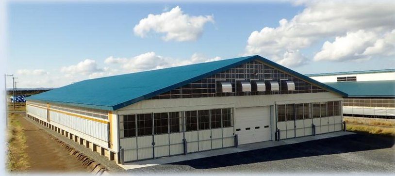
H27 猿払村営牧場 牛舎 現場代理人