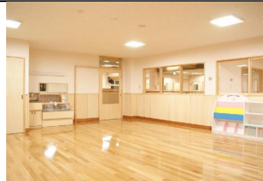
建設地:室蘭 用途:保育所 構造:RC2階建