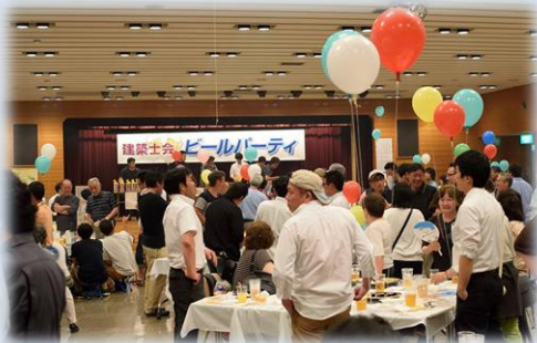
毎年恒例ビールパーティー