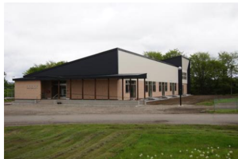
別海町中央児童館 役場 監督員として