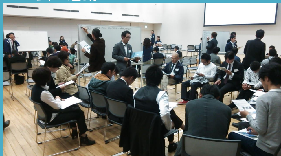
全国建築士フォーラム in 石川