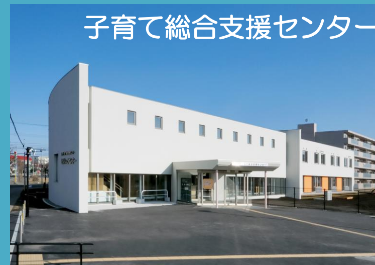
子育て総合支援センター