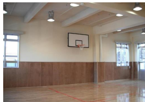
建設地:室蘭 用途:児童福祉施設 構造:RC3階建