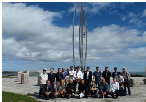
室蘭支部視察研修会(紋別市)