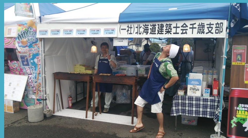
スカイ・ビア&YOSAKOI 祭 出店