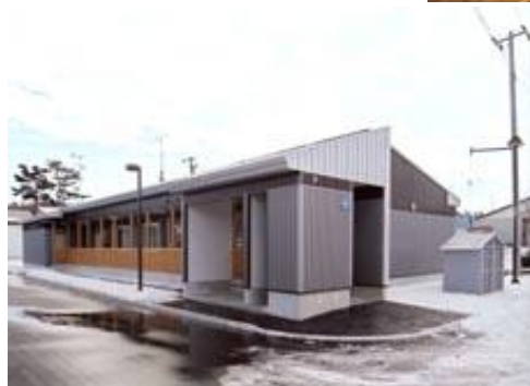
中標津町 計根別公営住宅 現場代理人として

士会活動 なかしべつじどうかんまつり H27年度は児童館を忍者屋敷 にして子供たちに楽しんでもら いました。