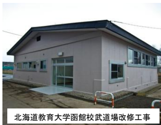
北海道教育大学函館校武道場改修工事