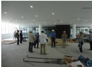
函館アリーナ現場見学会

「スキルアップ」「地域貢献」「仲間づくり」をテーマに活動している北海道建築士会函館支部。今年は「ひろげる つなげる」をキーワードに、さらにその輪を広く大きくしていく活動を展開していきます。