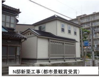
N邸新築工事(都市景観賞受賞)