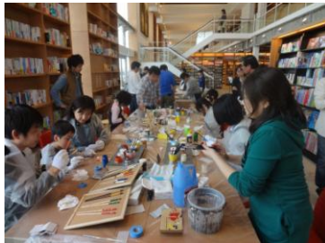
マイ箸づくりイベント

【スキルアップ】 工事現場や各種工法を見学し、説明を受けることで、スキルを高める活動しております。