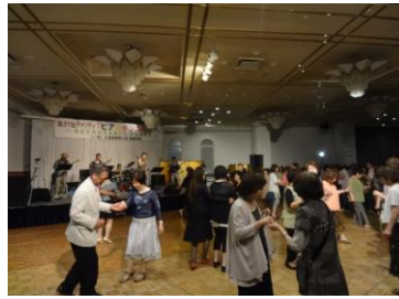
ピア&ダンスのタベ

【地域貢献】 マイ箸づくりイベントやお仕事体験イベントなどを通して子供たちに建築やものづくりの楽しさを知ってもらう活動をしています。 また、街の活性化のために地域住民や専門家を一堂に招き、町の未来を考えるパネルディスカッションを行うイベントなども行っています。