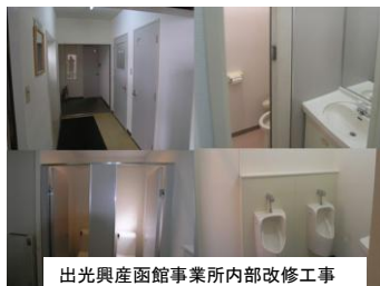
出光興産函館事業所内部改修工事