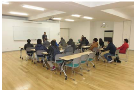
吉田氏による講義