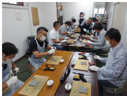
作 業 風 景