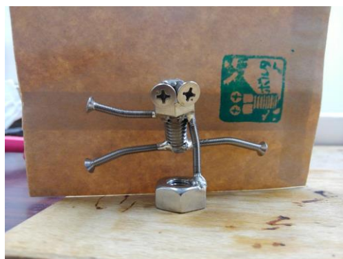
完 成 品