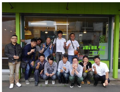
記 念 撮 影