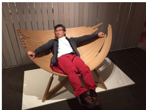
この椅子は座りにくい