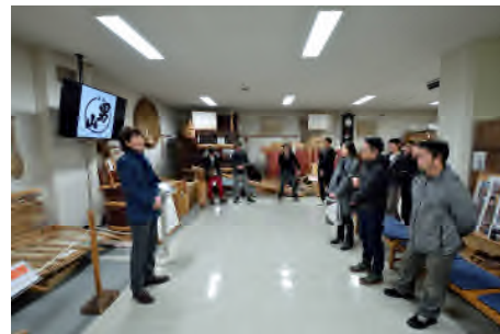
石塚委員長より男山資料館にて熱い総評を頂きました。