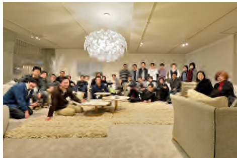
集合写真 カンディハウスショールームにて

数々の名誉を受賞しているカンディハウスは、つねに「より質の高いものづくり」を追求し、木の特性を活かしたデザインと職人の情熱・技術が『MADE in JAPAN』または『ものづくり日本』の伝統技術を世界に誇れる家具として感じとれました。