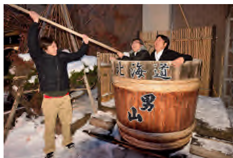
スペースが余ったので