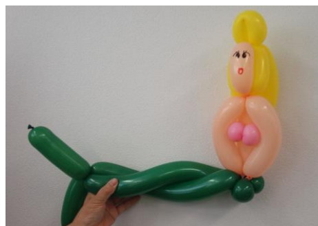
スペースが余ったので