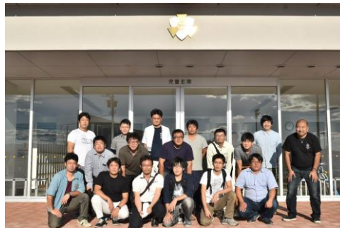
名寄南小学校見学会での集合写真