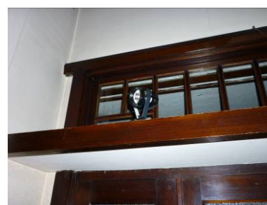
<照明計画を組み立て、設備工事を行なった>