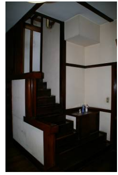
<保存再生を検討し始めた当初の坂牛邸の内部写真>