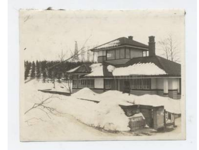
<坂牛ご夫妻から提供された古い写真から、復元考察を行なった>