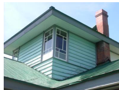
<破損した窓の部品から考察し、復元工事を行なった>