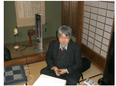
<専門家や事業者、建築士を交えて、小樽ワークスメンバーでの検討会議や勉強会などを開催>