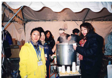
ビストロ建築士会 で~す!

そんな私たちの作る「ビストロ建築士会」の甘酒は雪あかり時期限定で1杯、100円。来年は、どうぞご来店ください。