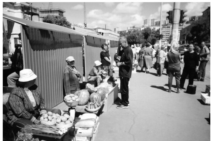
バザールでござーるヨ。