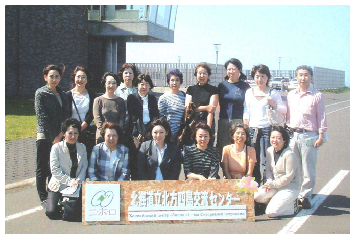
北海道北方四島交流センターにて

翌日は女性建築士の集いで北海道北方四島交流センターの見学をしました。「ニ・ホ・ロ」の愛称で呼ばれ、日本（ニ）とロシア（ロ）をつなぐ北海道（ホ）の交流拠点施設の意味だそうです。語り部である元島民の女性から子供の頃生活していた島の話からサハリンの収容所での強制労働の話など伺いました。館内を説明してもらいながら廻り、資料館展示室での地図では国後島のあまりの近さに驚きの声！ 交流センター見学の前に、江別の男性会員に納沙布岬を案内してもらっていた私達は、うっすらとかがかった霧で国境ラインの灯台を見ることができずに、時間切れで断念して戻ってきました。とても残念。岬の海岸線にへばりつく様にこんぶ漁をしている沢山の磯船を見て、国境ラインがすぐ間近にあるんだなとは思っていたけど本当に近い！ いつもと違った海岸線の風景を見ながらのドライブはとても良い気分転換になりました。