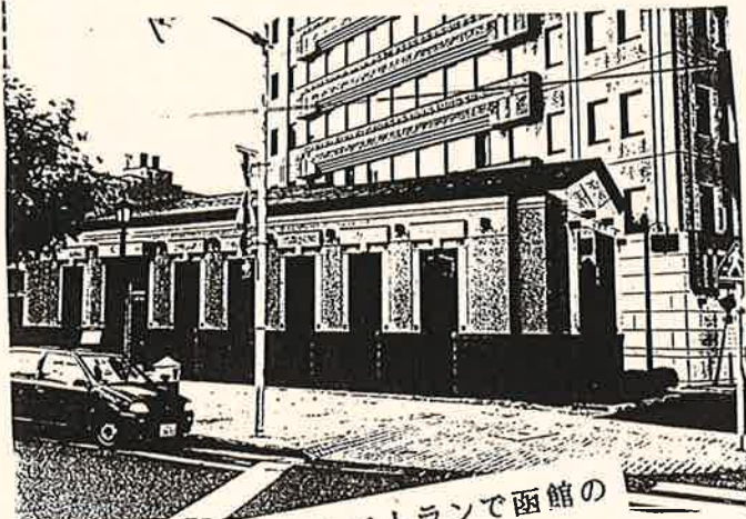
こんな素敵なレストランで函館の味覚、味わってみませんか？

ドアを開けて中へ入るとすぐに階段があり、レストランのフロアは地盤面より、1.5メートルほど下がった位置になっています。内装は木を主体としたぬくもりのある仕上がりで、照明器具も統一感のある材料にするなど、工夫されています。なんといっても天井高にゆとりがあり、のびやかな空間が開放的なくつろぎを与えてくれます。