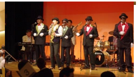
▲余興(ドラフターズオンステージ)