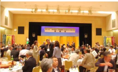
▲大会「懇親会」*参加者：301 名